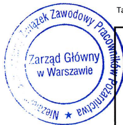
Tabela nr 1